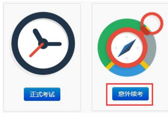
图 4 意外续考