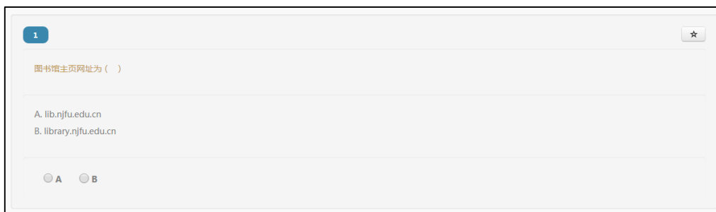
图 5 试题样例