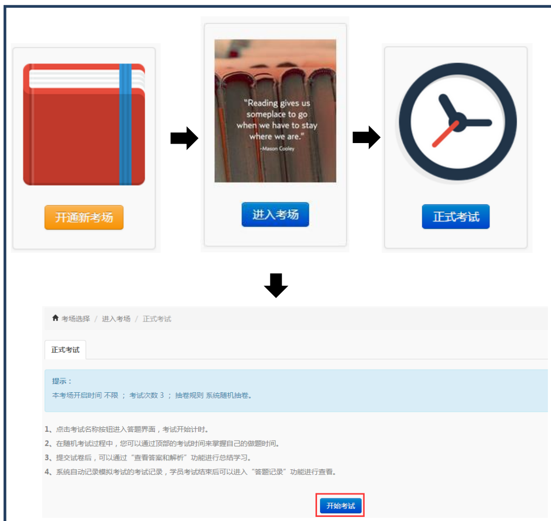
图 3 四步流程具体图示